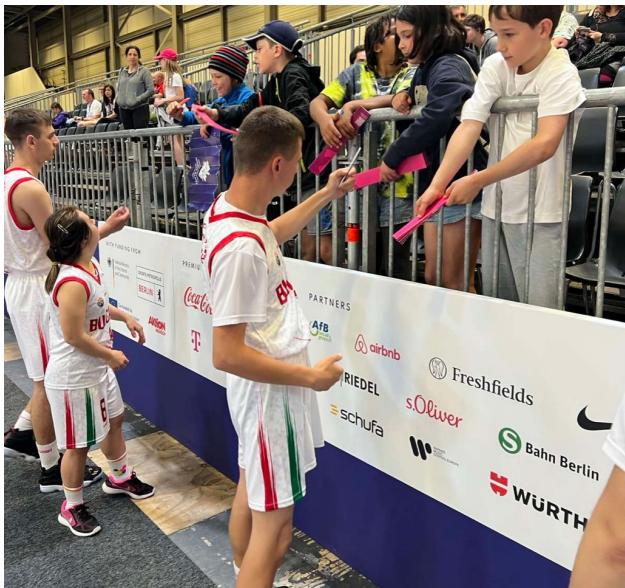
Отборът по баскетбол и новите им приятели.

На 26 юни участниците се завърнаха в България. Сега програмата Спешъл Олимпикс България започва кампания на име НЕПОБЕДИМИ ЗАЕДНО! Така повече хора ще могат да научат за участието и постиженията на българските атлети с интелектуални затруднения в Олимпиадата. Но не само за спортната страна на участието! Също така ще се покажат смелостта им, радостта от постигнатото и новите приятелства.