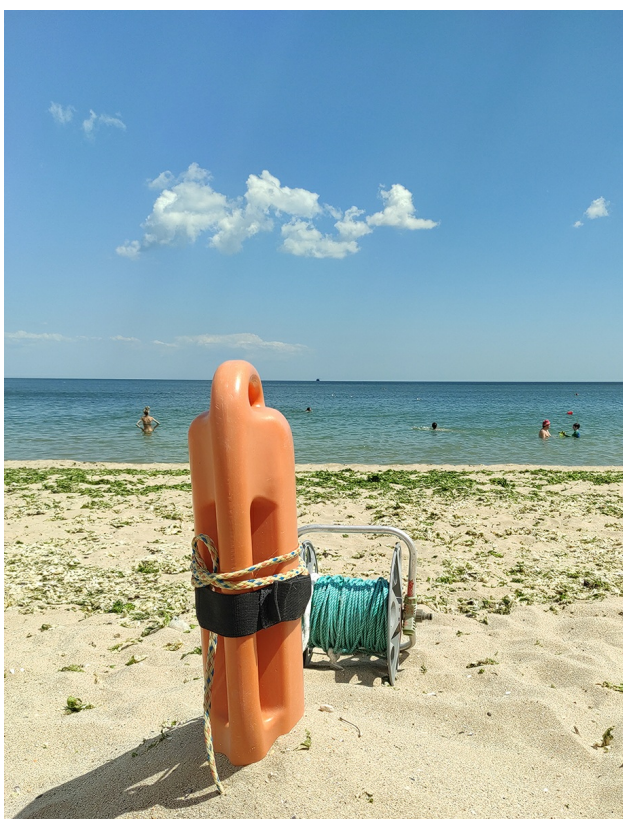
Спасителен буй.

- Пред нашия пост в морето има плаващ лек предмет, който се нарича шамандура. С него ограничаваме зоната за влизане на хора, които не умеят да плуват добре. Това означава, че зад шамандурата дълбочината е над 2 метра.