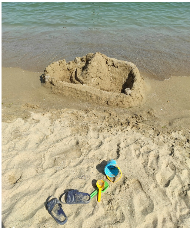
Да правиш замък на брега на морето, е приятно и безопасно.

- Тогава трябва да вика за помощ, без да го е срам. Спасителят ще отиде при него със спасителен буй и ще го изтегли. Ние имаме и много дълго въже, с което също можем да издърпаме човек от морето. Понякога използваме моторна лодка или джет, за да се придвижим по-бързо.