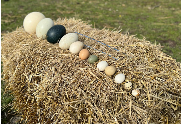
Част от колекцията яйца на зоологическата градина в Бургас.

Птиците се различават по размери, големина на клоната и цветовете на перата. Така е и с техните яйца. Има големи и малки, безцветни и шарени яйца. В колекцията на зоологическата градина в Бургас най-голямото яйце е на африканския черен щраус. Това е най-голямата птица в света. Яйцето е с много дебела черупка и тежи колкото 48 кокоши яйца. Много тъмно зеленикавосиньо е яйцето на птицата ему от Австралия. То не избледнява с времето. Яйцето е с такъв цвят заради каменистата почва, върху която емуто снася в своята родина. Така яйцето не се отличава от земята и хищните животни не могат да го забележат. Светлозелено е яйцето на щрауса тинаму. Това е най-малкият от всички видове щрауси. Най-малкото яйце е това на калифорнийския пъдпъдък. Той е малко по-едър от врабче. А знаете ли, че има и яйца колкото царевично зърно? Много малки са яйцата на папагала монах и на вълнистия папагал. Те също се отглеждат в зоологическата градина в Бургас.