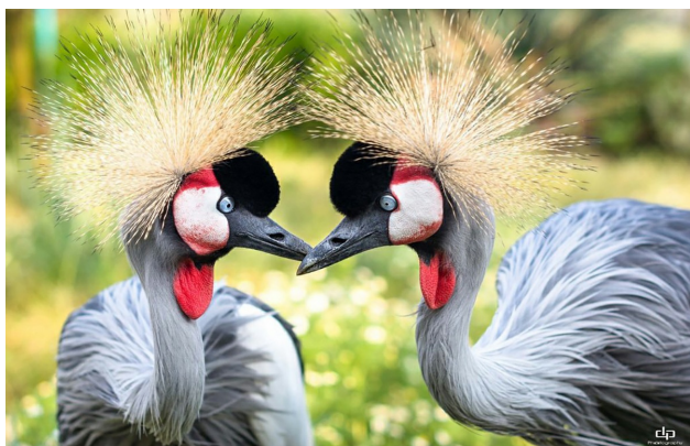
Сив коронован жерав.

В бургаската зоологическа градина най-много на брой са пауните. Тук живеят около 30 разновидности на пауни в разнообразни цветове! Родината на пауна е Индия. Там тази птица е свещена и обявена за защитен вид. Смята се за символ на радост, красота, любов и благодат. Нарича се още царска птица заради красивите опашки на мъжките. Когато те ги разперят, все едно се обвиват в шарено ветрило.