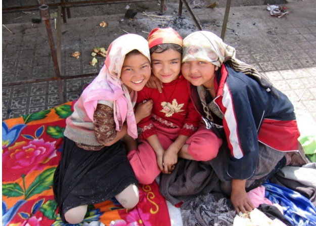
Уйгурски деца.