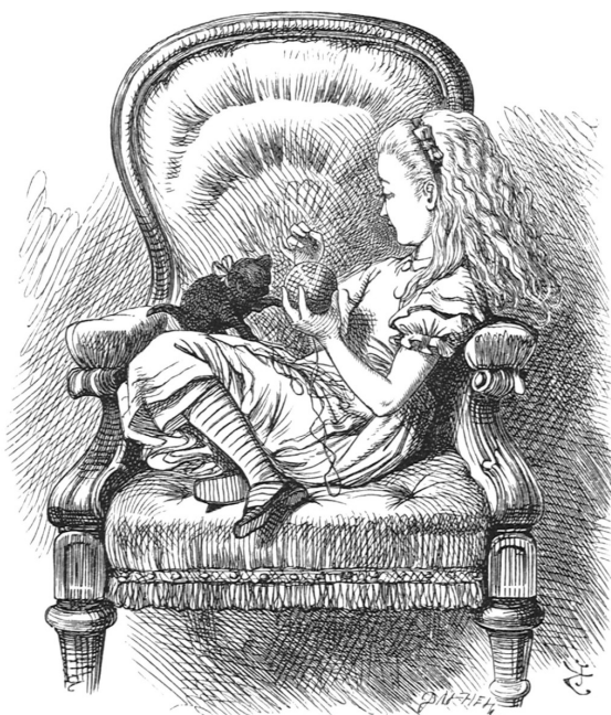
Алиса, нарисувана от Джон Тениъл, първия илюстратор на книгата

Алиса присъства в две книги, написани от Луис Карол. „Алиса в Страната на чудесата“ излиза за първи път в Англия през 1865 г. Шест години по-късно е издадена „Алиса в Огледалния свят“. И днес тези две книги се четат от деца и възрастни. Те са преиздадени много пъти. Различни художници са ги илюстрирали. По тях са създадени много филми, театрални и музикални спектакли, балети и комикси. За такива литературни произведения казваме, че са се превърнали в класика.