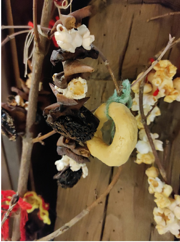
Кравайчетата за сурвакарите могат да се сложат на сурвакницата и да се ядат

Ако си правите сами сурвакница, според обичаите тя е дълга около един метър. Две клончета се извиват като венче. Задължително трябва да има нещо червено – конец, чушка, кърпичка. В нашите вярвания червеното се свързва с живота и силата. Колкото по-богато е украсена сурвакницата, толкова по-богата ще е новата година! За украса някога се слагали нанизани на червен конец пуканки и сушени плодове. Една скилидка чесън пази от болести. Паричката е символ на благополучие. Парченце ябълка е символ на плодородие. Кравайчета се правели за дар на сурвакарите от тестото за обредния хляб. Те също се окачват на сурвакницата, но могат и да се ядат. Може да се сложи и кърпичка на върха.