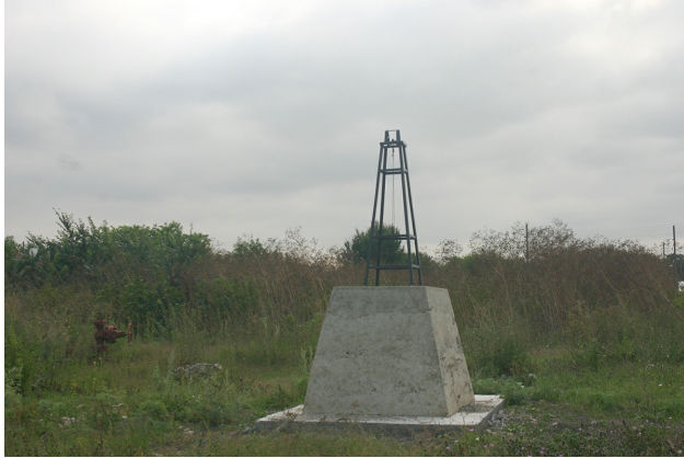
Паметник на нефта в Тюленово.

В селото може да се види и Паметник на нефта. Той се намира на мястото, където през 1951 г. е открито първото българско нефтено находище. Но Тюленово е преди всичко рай за водолази, гмурчачи и спелеолози. Така се наричат хората, които изследват пещерите. За подводните спортове винаги търсете специални инструктори! Ако обичате да рисувате, Тюленово ще ви стане любимо място. Много български художници са посветили картини на скалите край Тюленово.