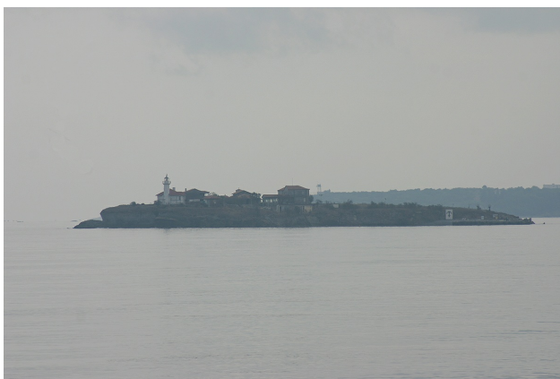
Остров Света Анастасия, когато над морето има лека мъгла.

От Бургас специално корабче ще ви отведе до остров Света Анастасия, покровителка на лекари и аптекари. Бързо ще стигнете до острова в Бургаския залив. Само за 10 минути можете да го обиколите. Има обаче много, което да научите.