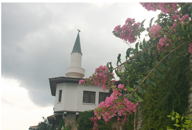
Дворецът в Балчик - вила „Тихото гнездо“.

Това е място, пълно с история. Дворецът се намира на балчишкия бряг. Състои се от 46 отделни сгради, които една с друга не си приличат. Такова е било желанието на някогашната румънска кралица Мария. Тя си построява дворец край Балчик, за да си почива там през лятото. Строителството му е завършено през 1936 г. Тук можете да преминете по Мост на въздишките и да видите Храма на водата, известен като нимфеум. Така се нарича храм, посветен на древногръцките покровителки на природата - нимфите. Край Двореца в Балчик има прекрасна ботаническа градина. Тук има повече от 4000 вида растения и дървета! Сред тях е бонбоненото дърво. Нарича се така, защото дръжките на плодовете му са сладки и се ядат.